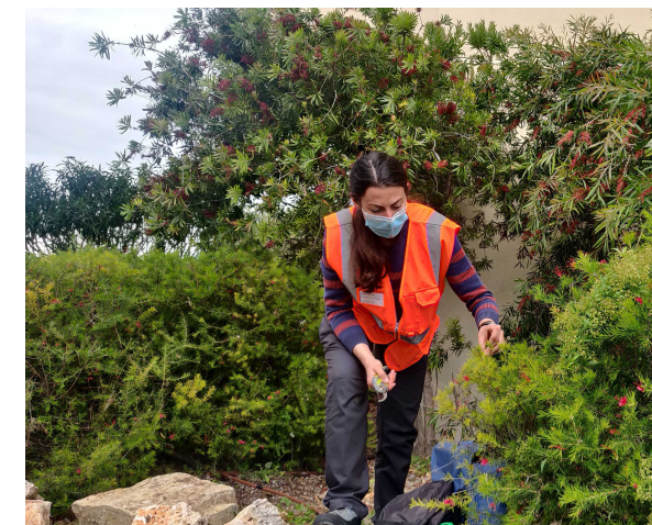
Réalisation d'un prélèvement sur le terrain.

Champignon spécifique pénétrant dans l'arbre par blessures, fréquemment liées aux activités humaines (travaux d'entretien, ...). Très virulent, peut détruire en quelques mois les platanes les plus vigoureux. Présent en France.